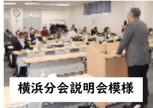
横浜分会説明会模様