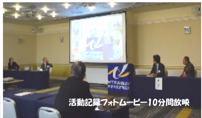
活動記録フォトムービー10分間放映