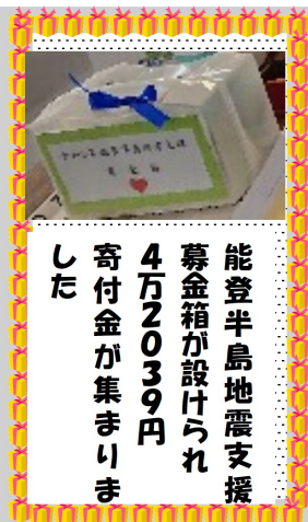
能登半島地震支援募金箱が設けられ4万2039円寄付金が集まりました