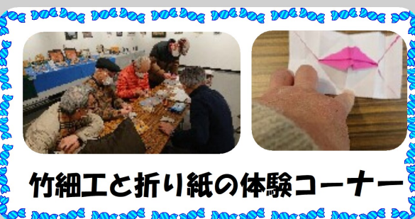
竹細工と折り紙の体験コーナー